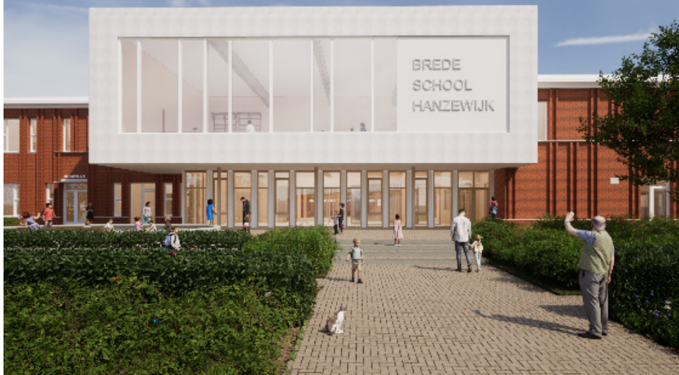
Het meest circulaire Kindcentrum van Nederland

Gemeente Kampen bouwt een nieuwe Brede School die onderdak biedt aan twee integrale kindcentra en een gezamenlijke gymzaal. Het circulaire en bio-based gebouw is straks hét multifunctionele hart van de wijk.