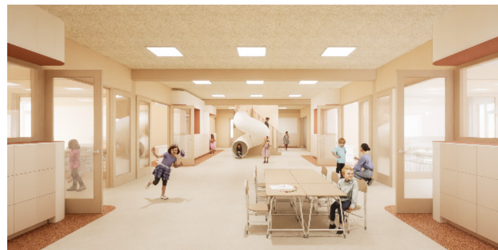
Impressie leerpleinen O.J.S. Het Scala en IKC Bouwman